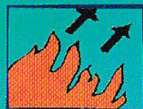
Определите направление распространения огня