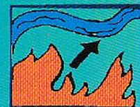
Выберите маршрут выхода из леса в безопасное место